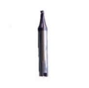
F007SILCA SILCA FRESA TITANIO VIPER ORIGINAL (F007SILCA)