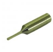
GEDGE GUIA PARA KIT EDGE VIPER DA SILCA (GEDGE)