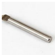
F01082 FRESA ÂNGULAR DE 82° (KESO) (F01082)