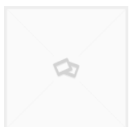
D741447ZB FRESA MULTI PONTO METAL DURO (D741447ZB)