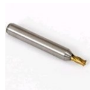
F011 FRESA PANTOGRAFICA DE 3,00 MM (F011)