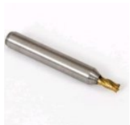
F009 FRESA BIANCH PANTOGRAFICA DE 2,5 MM (F009)