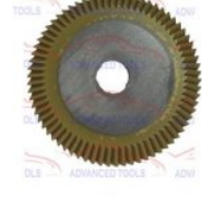
F005SILCA SILCA FRESA DELTA TITANIO SILCA (F005SILCA)