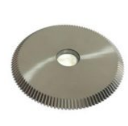
RIC01717B FRESA PARA MÁQUINA CARAT KEYLINE QUATTRO METAL DURO (VIDIA) ORIGINAL (RIC01717B)