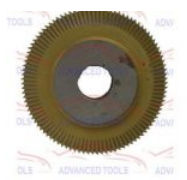
F006 FRESA 060MM TITÂNIO MÁQUINA N° 2 (F006)