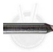
D741441ZB FE08 FRESA TWISTTER (D741441ZB)