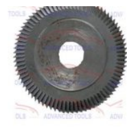
F004 FRESA INTERMEDIÁRIA ORIGINAL (F004)