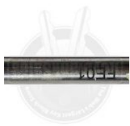
D741127ZB FE01 FRESA TWISTTER (D741127ZB)