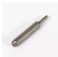
G003 GUIA CONVENCIONAL DE 3,0 MM (G003)