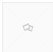
RIC01793B FRESA ANGULAR 90° KEYLINE T-REX / PUNTO (RIC01793B)