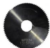
RIC09168B FRESA YALE PARA NINJA TOTAL KEYLINE