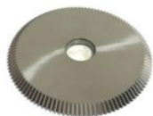
RIC02098B FRESA HSS 80° PARA MÁQUINA EASY KEYLINE