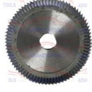
F005 FRESA HSS 070 MM MÁQUINA N° 5 (F005)