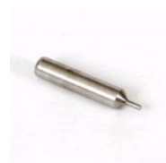
GVIPER GUIA PARA A MÁQUINA VIPER (GVIPER)