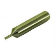
G001SILCA GUIA VIPER ORIGINAL SILCA (G001SILCA)