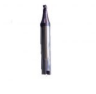
F004SILCA FRESA SILCA VIPER (F004SILCA)